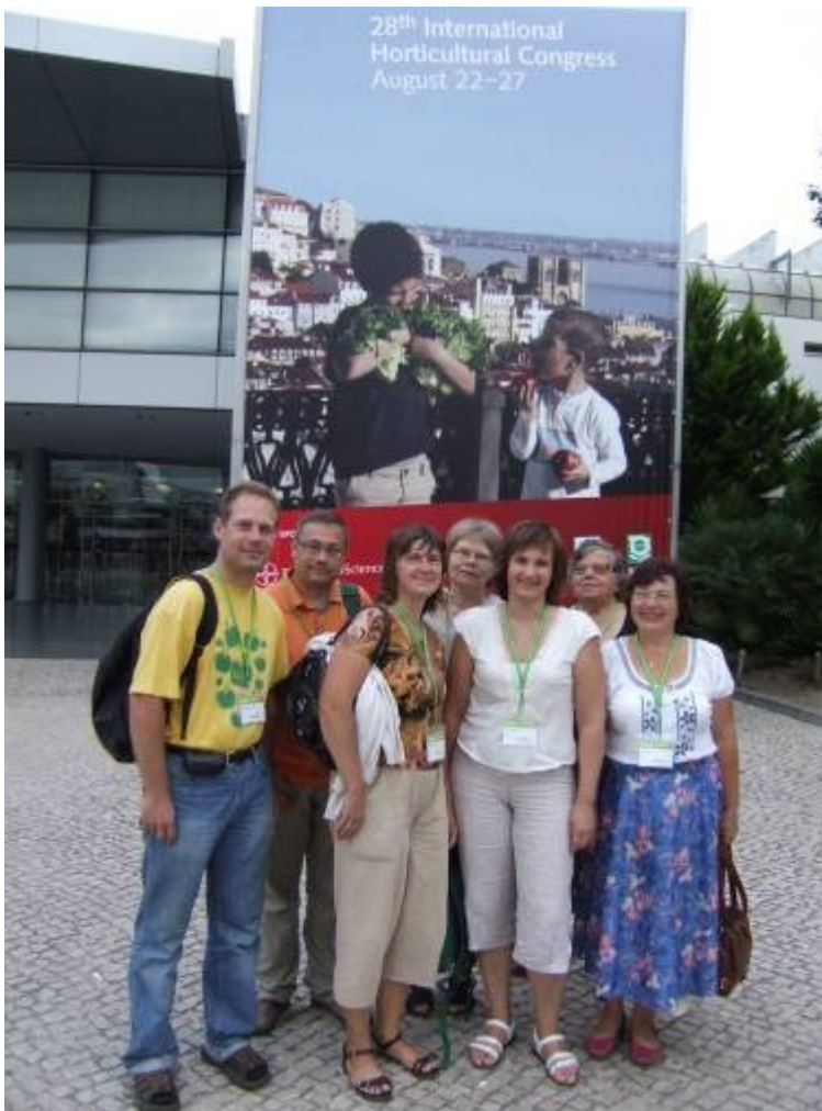
Latvijas zinātnieku (t.sk. 5 LVAI zinātnieki) delegācija Pasaules Dārzkopības kongresā Lisabonā (Portugālē)